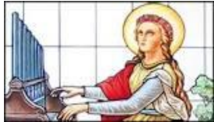
Sv. Cecília – patrónka hudby a hudobníkov